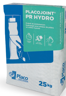
Enduit en poudre (10 kg ou 25 kg)