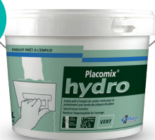
Enduit prêt à l'emploi (15 kg)