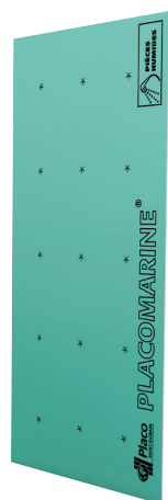
Plaques de plâtre, cloisons ou complexes isolants hydrofugés*

Les SOLUTIONS PLACO® pour les LOCAUX HUMIDES PRIVATIFS (EB+p)