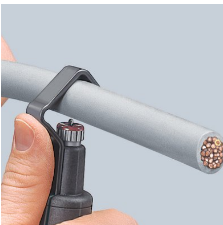
positionnement de l'outil pour coupe périphérique

Sous réserve de toute modification technique et erreur.