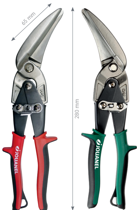
Cisaille à gauche

Particulièrement appréciée dans les métiers de la ferblanterie, la cisaille passe-tôle Pélican démultipliée est idéale pour réaliser des coupes continues en pleine tôle. Son articulation spécifique offre une démultiplication réduisant considérablement la force à appliquer lors de la coupe