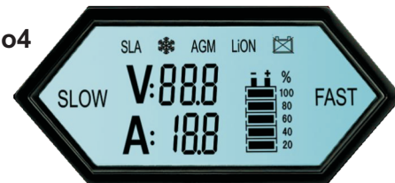
Ecran LCD rétro-éclairé