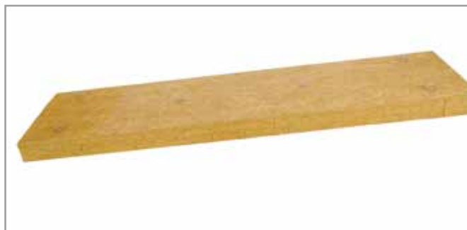
ROCKFEU SYSTEM dB