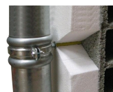
Fixation de descente d'eaux pluviales - vue en coupe 2