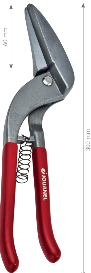
Cisaille à droite