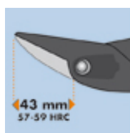
Dureté de l'acier 43