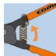
Ressort de rappel