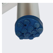
Sabots antidérapants pour assurer la stabilité du modèle 2,90 m