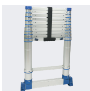
Stabilisateurs rétractables pour les modèles 3,20 / 3,80 et 4,40 m