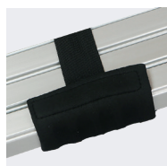
Poignées de confort pour faciliter le transport