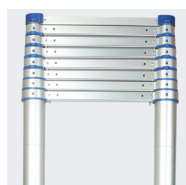
Hauteur ajustable selon les contraintes du chantier