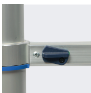
2 boutons poussoir pour replier l'échelle