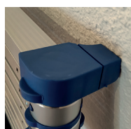
Embouts d'appui pour une parfaite stabilité