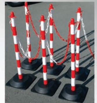
Avec poteaux ref. 53 03 01