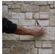
2 - J'élimine le surplus de colle