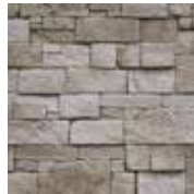
3 - J'hydrofuge pour l'extérieur

Calepinage = Façon de disposer les éléments de parement pour obtenir un ensemble harmonieux