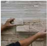
1 - Je pose