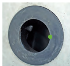
entrée des effluents B