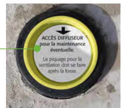
orifice de maintenance A