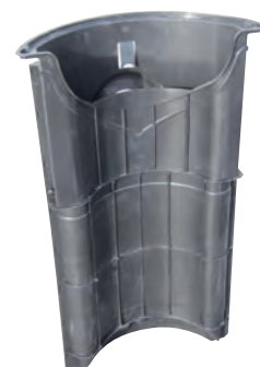
corps du préfiltre