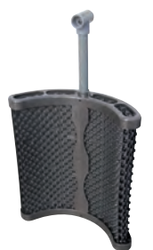
cassette du préfiltre