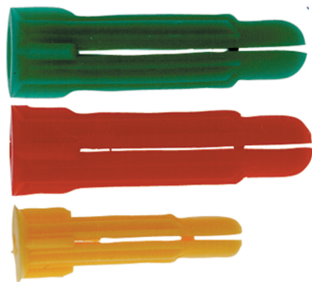
Fixation multi-usages PC