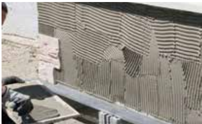
Double encollage obligatoire.