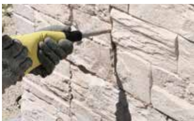
Jointer à la poche à joints.

Prévoir des joints de fractionnement tous les 60 m 2 .