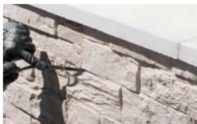
Lisser à l'aide d'un fer à joints.

Nos parements ne nécessitent pas d'entretien particulier.