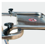
Tablette porte-outils en série (supporte 25kg max)