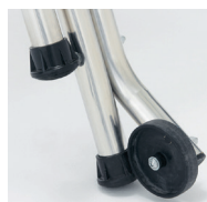
Roues Ø 100 mm