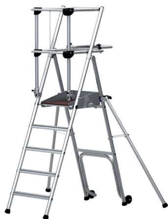
Modèle 5 marches

Cette plate-forme PIR/PIRL en aluminium Tubesca-Comabi est disponible de 2 à 5 marches. Elle permet d'accéder jusqu'à 3m15 de hauteur travail. Sa conception tubulaire, son encombrement réduit et son passage libre arrière font de cette plate-forme un produit léger et utilisable dans les endroits restreints. Il dispose d'un garde-corps rigide semi-automatique et de plinthes intégrées pour garantir la sécurité de son utilisateur. Avec ses 27 cm d'épaisseur replié, il se stocke facilement. La béquille arrière est étudiée pour passer au-dessus d'obstacles. Il répond aux normes PIRL 93-353 et au décret 2004-924. *Les modèles 2 et 3 marches n'ont pas de stabilisateurs.