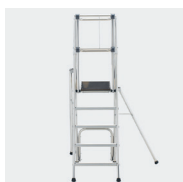
Utilisation contre un mur possible