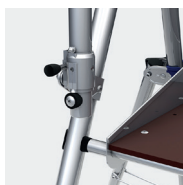
Système de verrouillage du garde-corps

Livré sous film rétractable avec PLV. La plate-forme est comptée comme une marche. Les modèles 02272512 et 02272513 n'ont pas de stabilisateurs.