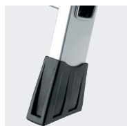
Sabot enveloppant antidérapant à plans coupés réf. 09007028