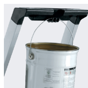
Crochet porte-seau 10 kg MAXI