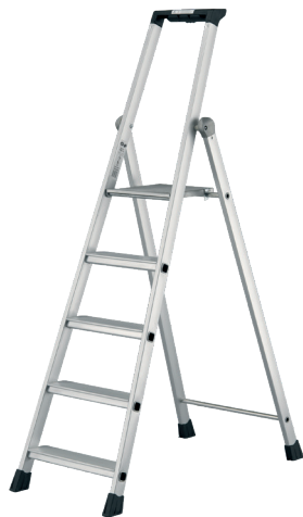
Modèle 5 marches

Le marchepied Compact est un marchepied en aluminium conçu pour un usage régulier. Ce produit qualitatif répond à la norme EN 131, au décret 96 333 et est labellisé NF. Disponible de 3 à 8 marches, il vous permet d'accéder en toute sécurité à une hauteur maximum de 3,64m. Ses marches mesurent 80 mm de profondeur, son porte-outils dispose d'un crochet porte-seau et sa plate-forme d'un crochet anti-repliement. Extrêmement léger et compact replié il se transporte et se stocke facilement. Livré avec deux sangles de sécurité pour le 7 et 8 marches.