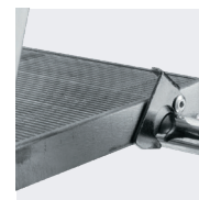
Verrou automatique anti-soulèvement du repose-pieds

Le repose-pieds est compté comme une marche. Livré emballé sous film avec PLV 2 sangles de sécurité pour 02372307 et 02372308, leur remplacement ne peut se faire qu'en usine.