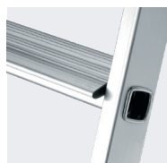
Sertissage des marches