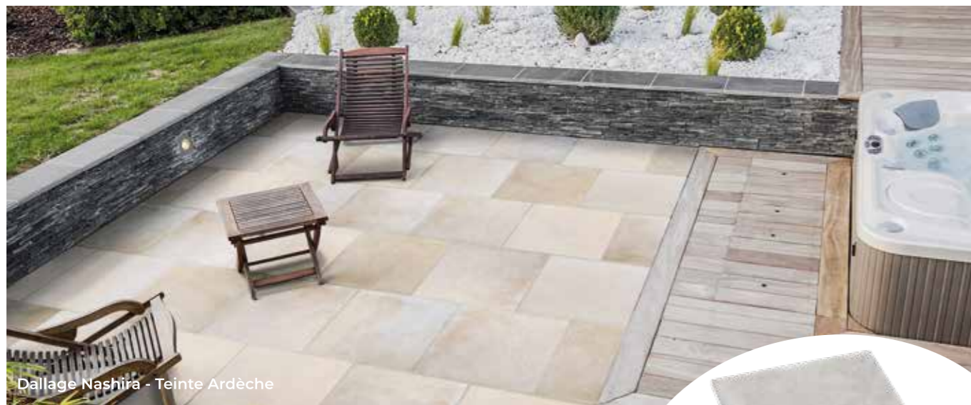
Dallage Nashira - Teinte Ardèche