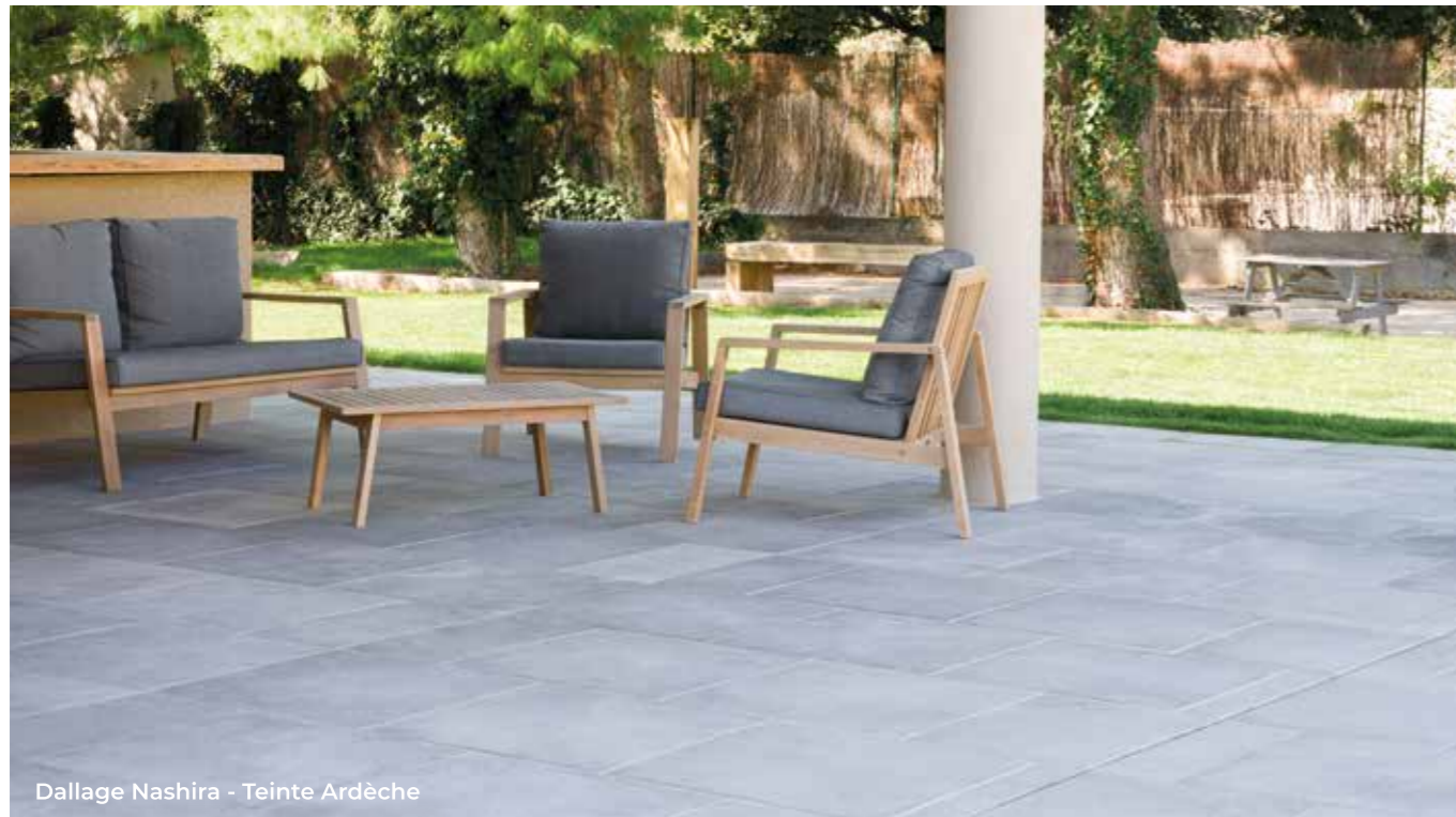
Dallage Nashira - Teinte Ardèche