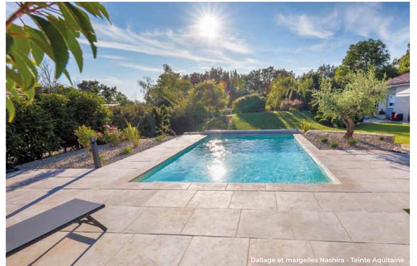
Dallage et margelles Nashira - Teinte Aquitaine

Retrouvez les informations produits en fin de cahier