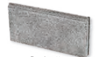
Bordurette Droite Teinte Anthracite

Bordurette Ovale : 50 x 24 x 6 cm Bordurette Droite 20 : 50 x 19 x 5 cm Bordurette Droite 25 : 50 x 24 x 5 cm