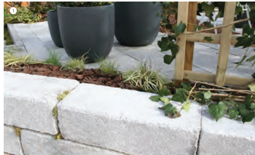
1 Muret Clairefontaine, teinte Gris nuancé 2 Muret Clairefontaine et pavé Navarre, teinte Gris nuancé

→ Pour plus de détails, voir le cahier technique p.133