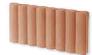
Bordurette Ovale Teinte Saumon