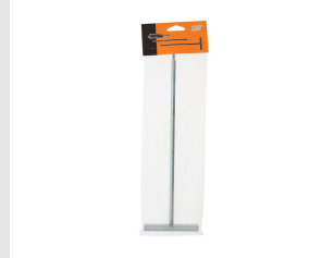
Eurocode 051009 POIGNEE EN T L300