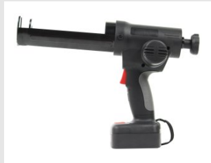
Eurocode 054298 ⚠