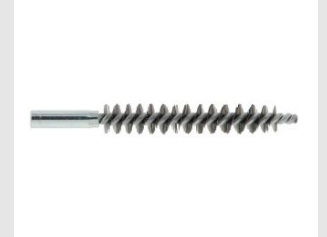
Eurocode 052972 ECOUVILLON D.13