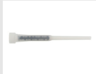
Eurocode 050882 BUSE STANDARD