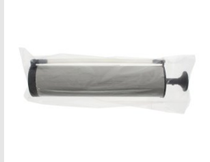
Eurocode 065990 SOUFFLETTE DE NETTOYAGE