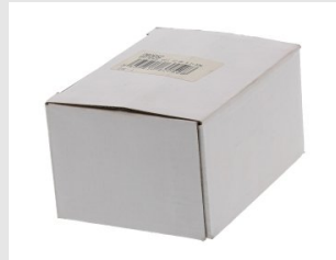
Eurocode 060052 ⚠ BATTERIE EGI 300 / 380 / 450 10,8V LI-ION