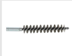
Eurocode 052976 ECOUVILLON D.26