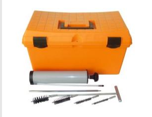
Eurocode 055832 KIT DE NETTOYAGE MANUEL