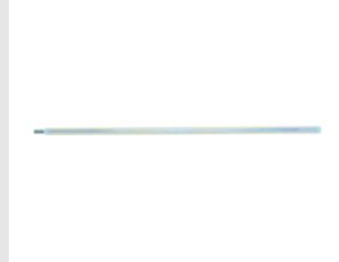
Eurocode 051010 RALLONGE L325