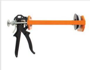
Eurocode 063750 OUTIL D'INJECTION MANUEL 825ML