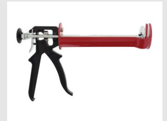
Eurocode 077151 OUTIL D'INJECTION MANUEL 380-410ML