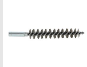
Eurocode 052971 ECOUVILLON D.11