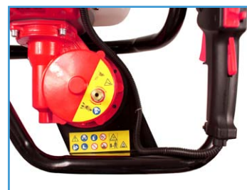
Embrayage centrifuge avec système de décompression