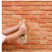
2 - Je réalise les joints