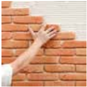
1 - Je pose en croisant les joints d'une rangée sur l'autre