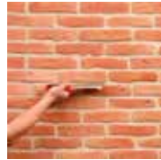
3 - Je brosse et j'hydrofuge

Calepinage = Façon de disposer les éléments de parement pour obtenir un ensemble harmonieux