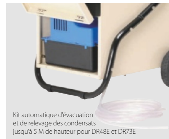
Kit automatique d'évacuation et de relevage des condensats jusqu'à 5 M de hauteur pour DR48E et DR73E