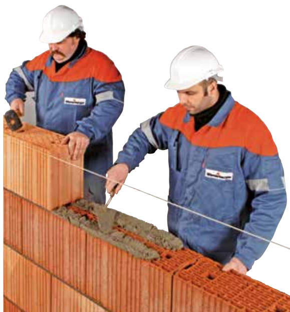
Brique pour Maçonnerie à la truelle