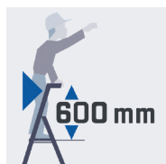
Maxi sécurité anti-basculement avant