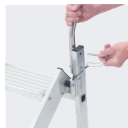
Goupilles imperdables de fixation du garde-corps