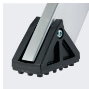
Sabots antidérapants vissés sur le montant

Le repose-pieds est compté comme une marche. Le garde-corps concerne uniquement les modèles 3 et 4 marches. Livrés emballés sous film