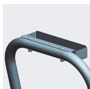
Option porte-outils (réf : 02374699)