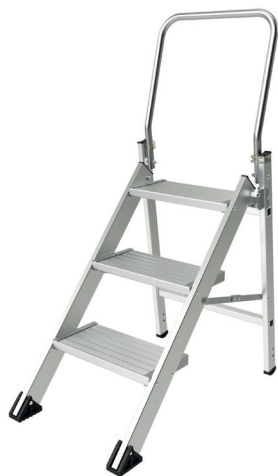
Modèle 3 marches

Le marchepied Confort pliant est extrêmement léger. Ses marches de 200 mm et son garde-corps assurent votre sécurité jusqu'à 2,94 m. Ce modèle est disponible de 2 à 4 marches avec roues et porte-outils en option. Il respecte la norme EN 14183 et le décret 96 333.