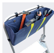
Porte-outils à fixer en option sur le garde-corps (02379499)