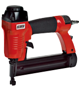
J 35 P1