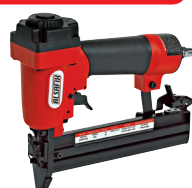
05J 32 P1