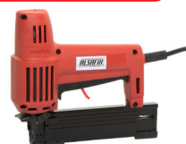
SKN 30 E