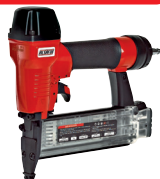
J 55 P1