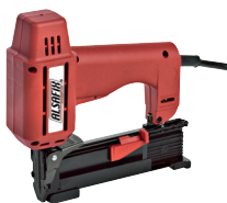
MET 32 C