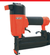
J 50 SVN