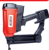
J 55 G1