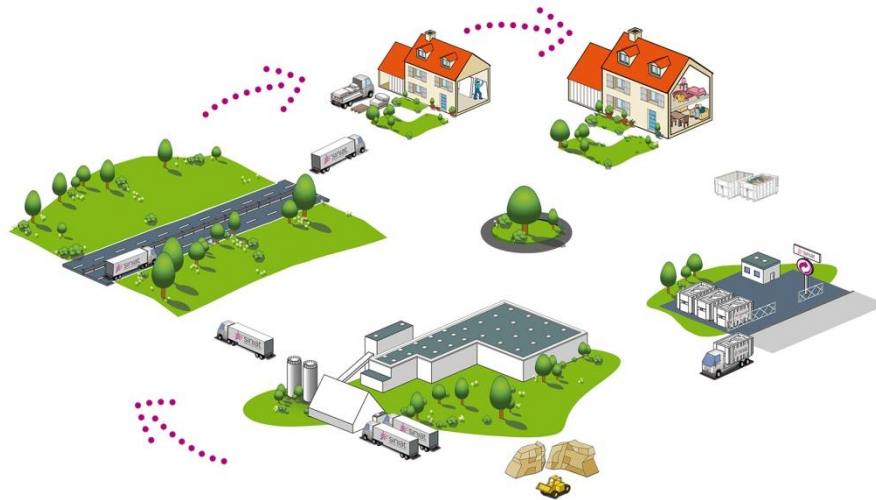
Schéma du cycle de vie