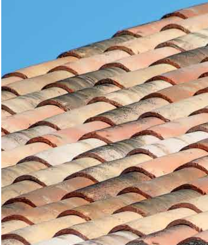
Coloris Nuances d'Antan