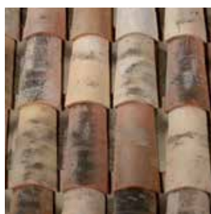
Dessus : Nuances d'Antan Dessous : Castelviel