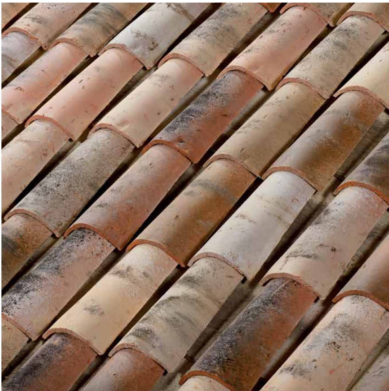
Dessus : Nuances d'Antan Dessous : Castelviel