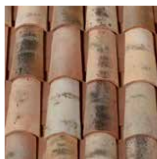
Dessus : Nuances d'Antan Dessous : Flammé Languedoc