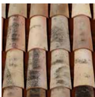
Dessus : Nuances d'Antan Dessous : Cathédrale